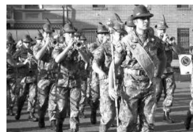
Un raduno di alpini

La scorsa settimana una delegazione della Commissione nazionale che dovrà