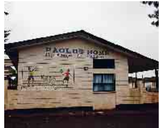
A sinistra: alcune immagini della baraccopoli di Kibera: una bottega di ciabatte, i bambini che giocano per le stradine strette e fangose dello slum, il centro "Paolo's Home" dove vengono aiutati i ragazzi di strada recuperati per le vie di Nairobi