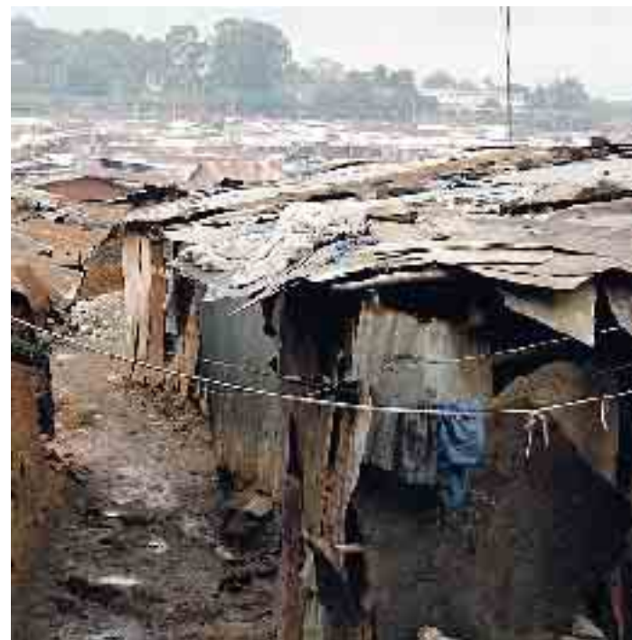
Ecco una immagine della baraccopoli di Kibera, la seconda come grandezza al mondo: ospita un milione e mezzo di disperati