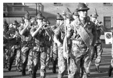
Un raduno di alpini

La scorsa settimana una delegazione della Commissione nazionale che dovrà